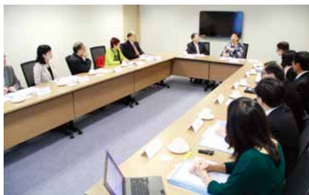
探訪通訊事務管理局辦公室

7.2 此外，新加坡公共服務委員會主席張贊成先生聯同十名委員在二零一四年九月到訪香港，其間與本委員會會面。雙方就兩地共同關注的公務員事務廣泛交流意見，收獲甚豐。