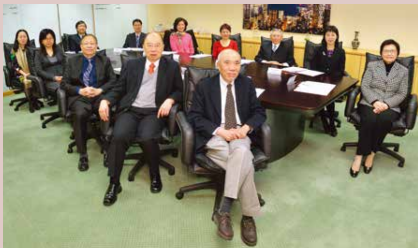
公務員事務局常任秘書長及同事出席公務員用委員會的會議