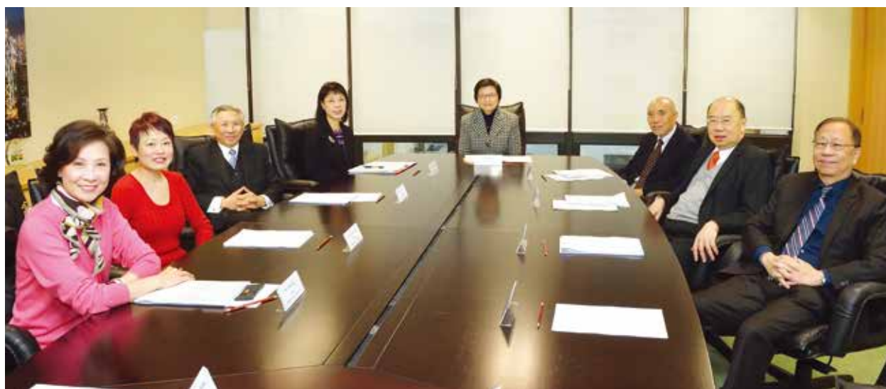
公務員 用委員會會議