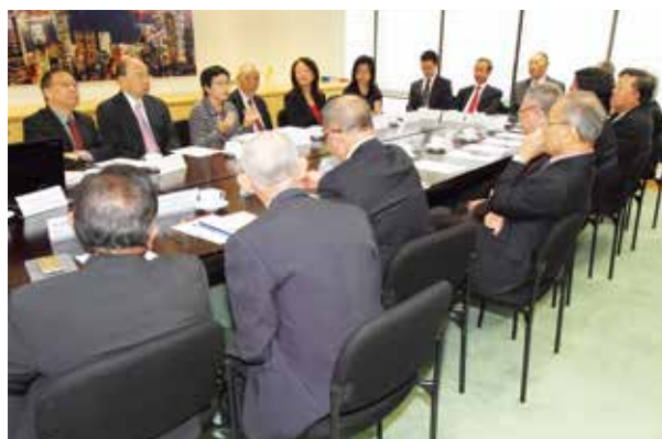
與新加坡公共服務委員會主席及各委員會面