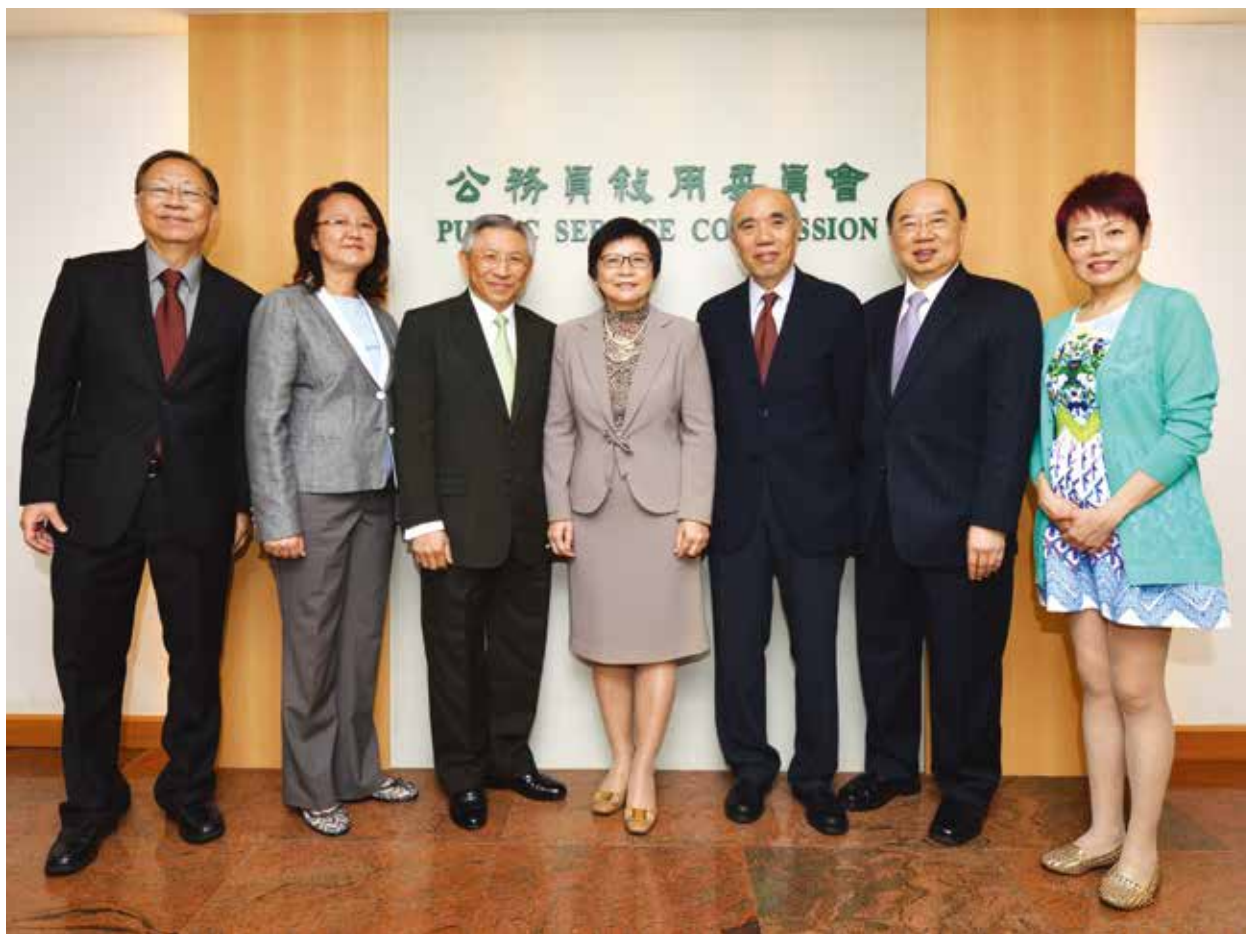
公務員 用委員會主席及委員

1.2 按照《公務員 用委員會條例》，委員會有一名主席和不少於兩名而不多於八名委員。成員全部由行政長官委任，並有擔任公職或服務社會的經驗。