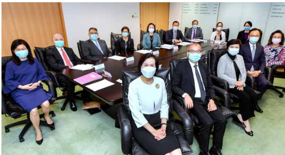
公务员叙用委员会会议